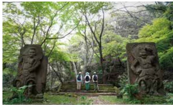
旧千燈寺跡の仁王像。 かつては六郷満山中山本寺として栄えた。