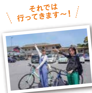
それでは行ってきます~!

伊予灘からの潮風や波音をBGMに、海岸沿いのサイクリングロードを駆け抜ける国東市。市内には「国東市サイクリングターミナル」を基点に2つのルートがあり、1つは片道約13・2キロメートルのコースを70分程で走る「Northコース」。より気軽さを求めるビギナーのために、約3キロメートルのコースを30分ほどで1周する「Southコース」も設けられています。