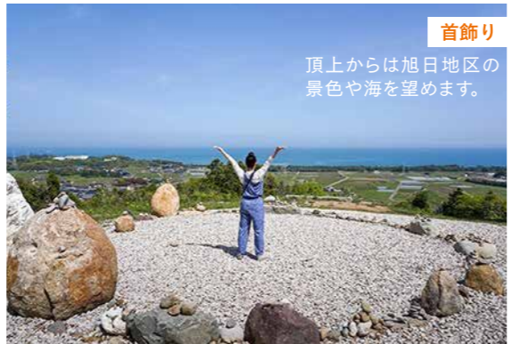
頂上からは旭日地区の景色や海を望めます。