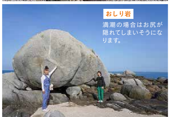
満潮の場合はお尻が隠れてしまうようになります。