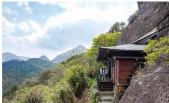
断崖の中に建つ五辻不動尊。