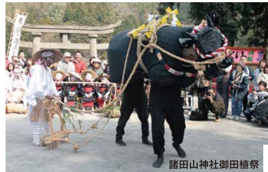
諸田山神社御田植祭