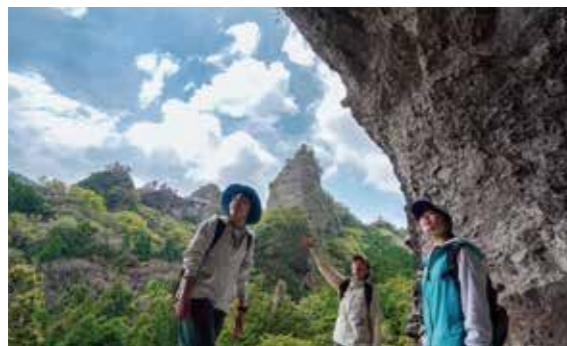
大不動岩屋から奇峰を望む。